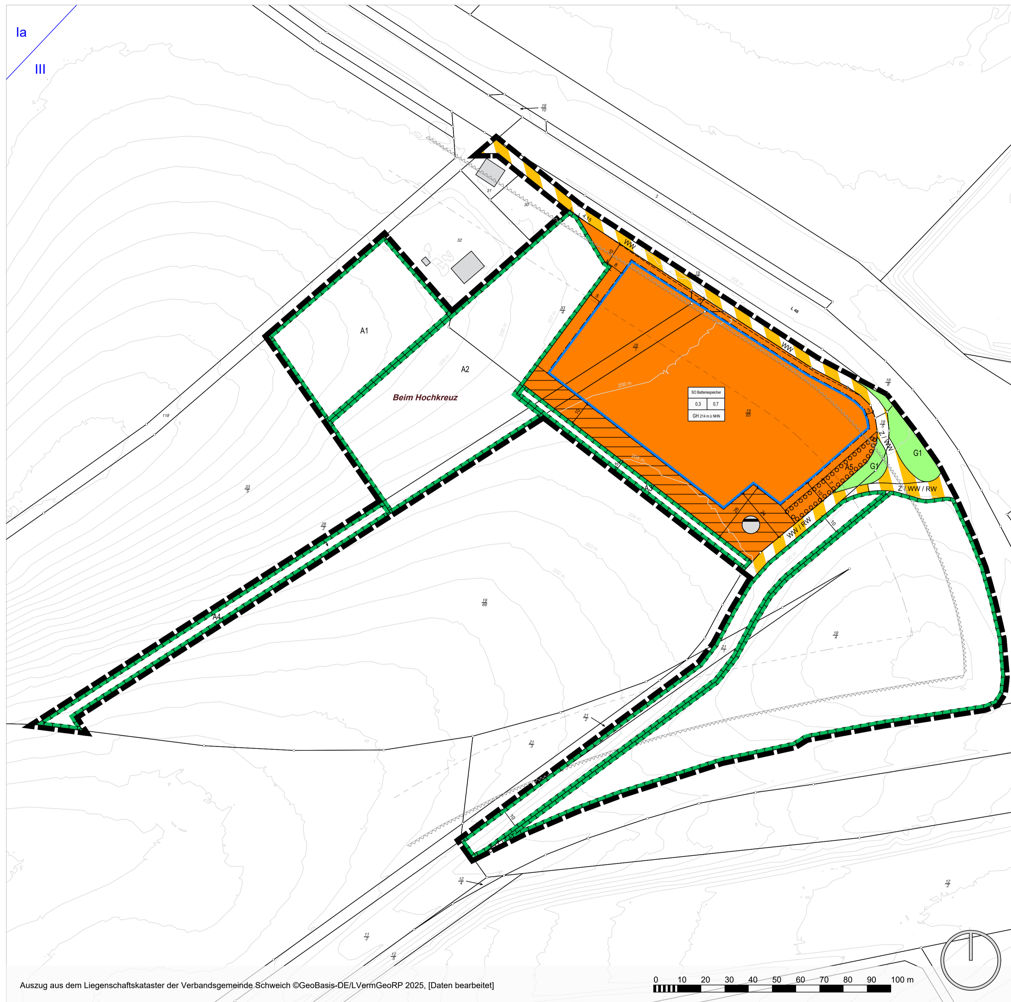
Auszug aus dem Liegenschaftskataster der Verbandsgemeinde Schweich